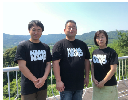
浜名湖バイブルキャンプスタッフ

同盟教団のキャンプ宣教が今年70周年を迎えました。 これまでの心暖まるご支援を感謝します。 今後も多くの人々の霊的な訓練と安息の場として、 また、救いと献身の場として神様に用いられるように ご協力ください。